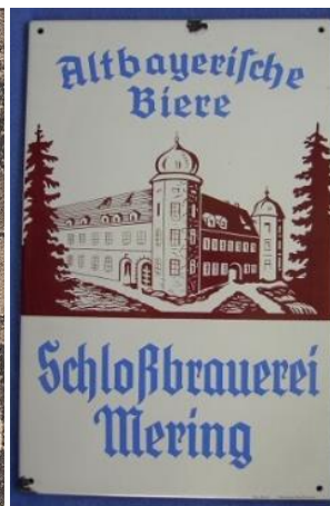
Bräu von Merching. Ausschnitt aus einer Postkarte um 1900. Emailleschild der Schloßbrauerei Mering.