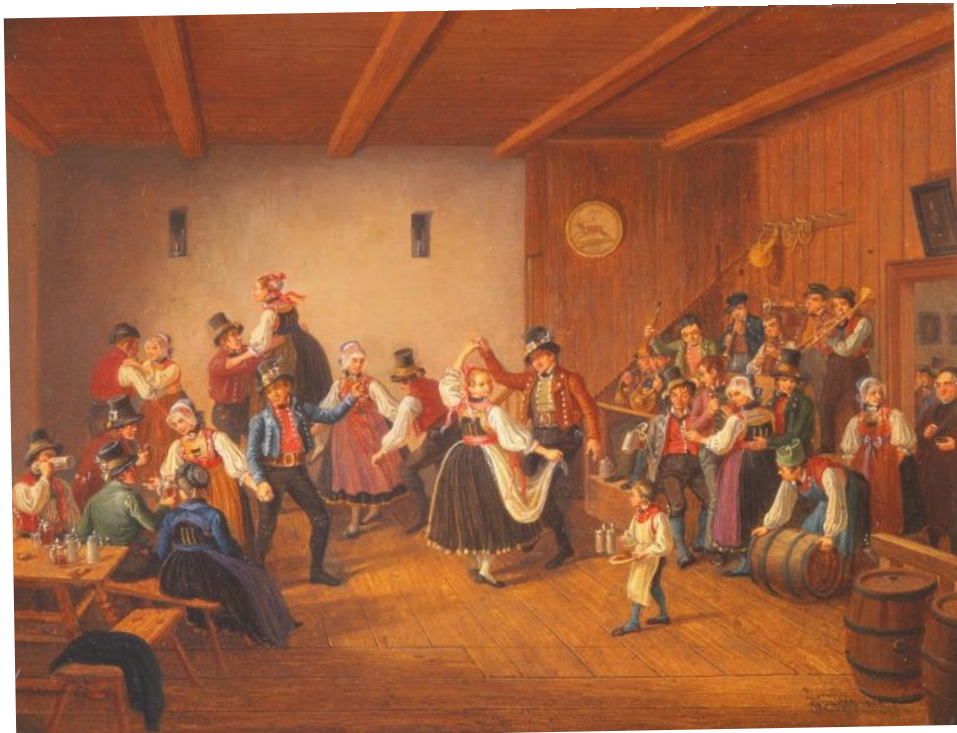
Lorenz Quaglio, Bauernhochzeit 1846, Privatbesitz.

So wurde 1860 das Kapitel über die Bierbrauerei in »Bavaria, Landes- und Volkskunde des Königreichs Bayern« eingeleitet. Wenn schon nicht gerade zu Revolutionen, so konnte es doch allenthalben zum Streit zwischen der Obrigkeit und den biertrinkenden Untertanen kommen, ja sogar zu Beschwerden der Dorfbevölkerung an den regierenden Kurfürsten.