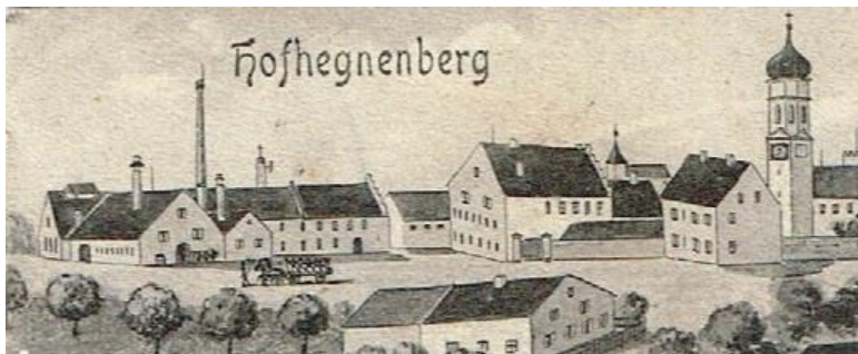
Brauerei Hofhegenberg, Ausschnitt aus einer Postkarte um 1900.